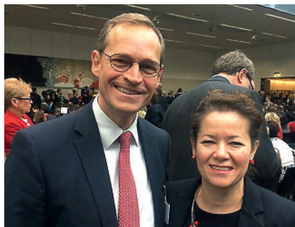
Mit dem Regierenden Bürgermeister von Berlin, Michael Müller diskutiere ich am 5. September über seine Idee für ein Solidarisches Grundeinkommen. Details finden Sie im Programm.