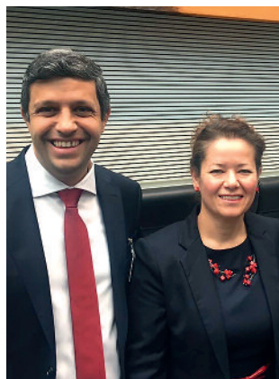
Mit dem Vorsitzenden der SPD-Fraktion des Abgeordnetenhaus von Berlin, Raed Saleh, besuche ich am 5. September den Verband alleinerziehender Mütter und Väter.

Ich lade Sie herzlich ein, mich in meinem Kiez-Büro zu besuchen, um über wirksame Instrumente gegen steigende Mieten zu sprechen. Die Adresse sowie weitere Informationen finden sie auf der Rückseite.