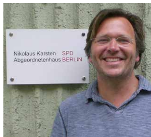
Mit meinem Wahlkreisbüro bin ich vor Ort für Sie da!